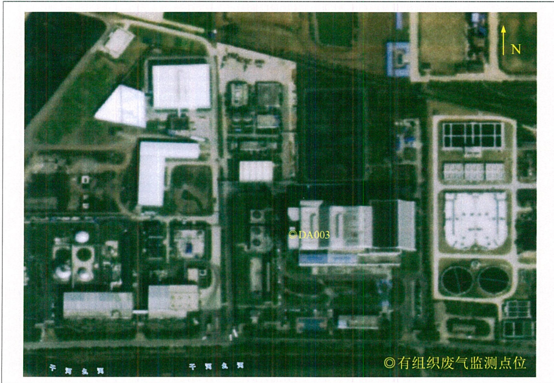
附图 2 现场监测点位图